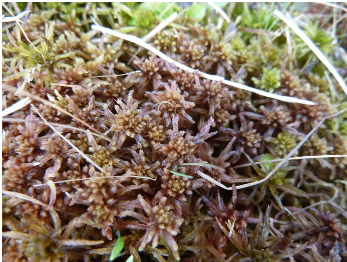
Rašeliník Sphagnum warnstorffii (PR Rašelištně Loučky).