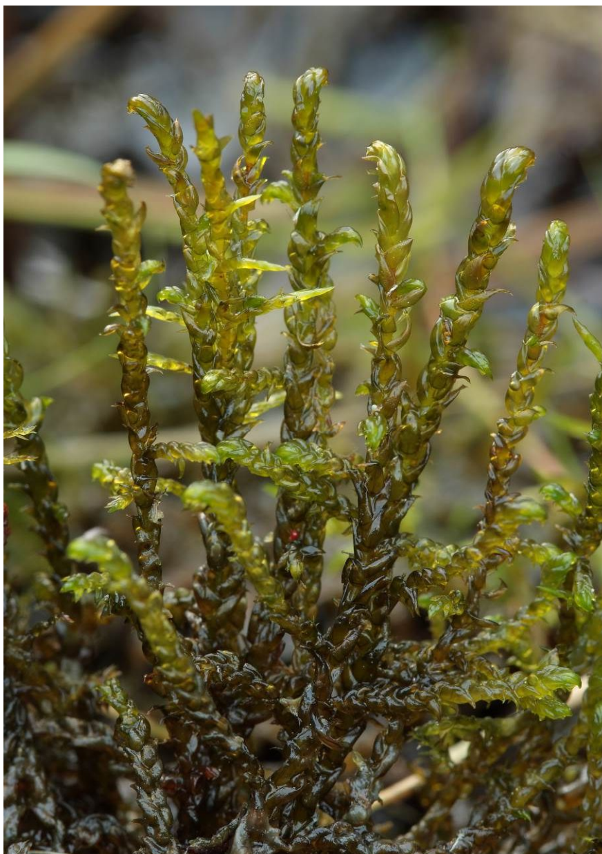
Scorpidium scorpioides (PR Chvojnov).