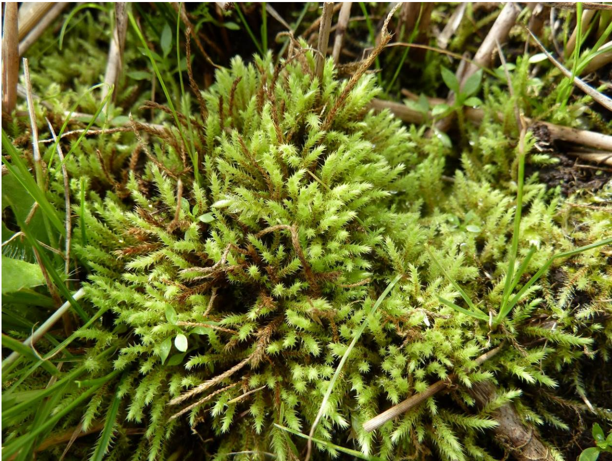
Porost Philonotis caespitosa (PR Na Oklice).